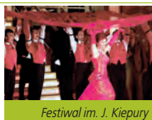
Festiwal im. J. Kiepury

Małopolska tętni życiem, a imprezy tu organizowane przyciągają gości nierzadko z całego świata. Trudno się temu dziwić, jeśli wymieni się choć kilka z nich: Małopolskie Dni Dziedzictwa Kulturowego, Festiwal Kultury Żydowskiej (Kraków), Międzynarodowy Festiwal Folkloru Ziem Górskich (Zakopane), Festiwal im. Jana Kiepury (Krynica) czy Międzynarodowy Festiwal Muzyki Kameralnej i Organowej (Wygielzów).