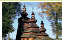
Cerkiew w Kwiatoniu