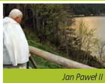
Jan Paweł II

Z regionem związani byli lub są ludzie tak sławni, jak: Ojciec Święty Jan Paweł II, gen. Józef Bem, Roman Ingarden, Tadeusz Kantor, Jan Kiepura, Tadeusz Kościuszko, Jan Matejko, Józef Mehoffer, Helena Modrzejewska, Sławomir Mrożek, Ignacy Jan Paderewski, Krzysztof Penderecki, Ludwik Solski, Wisława Szymborska, Józef Tischner, Stanisław Witkiewicz, by wymienić tylko niektórych wielkich Małopolan, którzy przyczynili się do rozwoju regionu, kraju, świata.